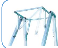
開閉式で出入りがスムーズに！！