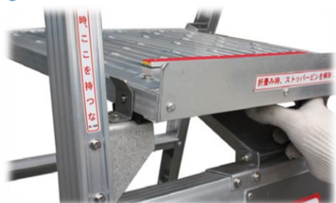
指挟み防止設計で安心