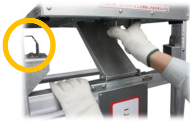
ロック機能で揺れを防止！